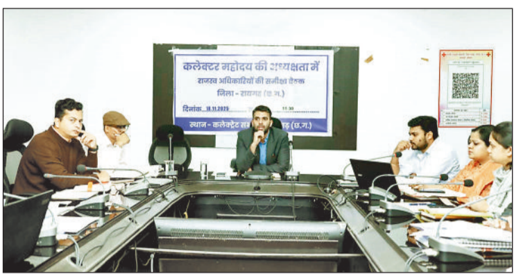
बैठक लेते कलेक्टर और उपस्थित राजस्व अधिकारी।